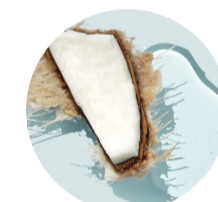
Agua de Coco