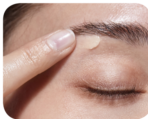
Ayuda a fijar las cejas