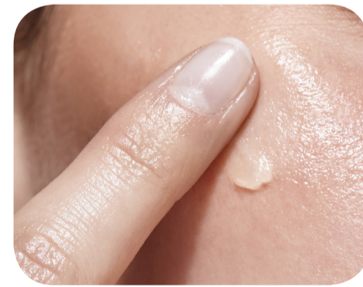
Suaviza la piel seca