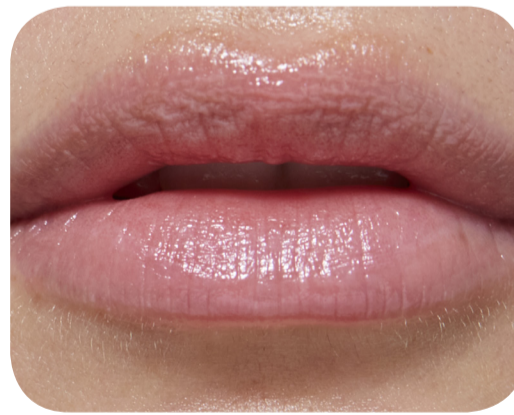
Nutre los labios resecos