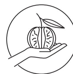
Elaborado con Mandarina de Origen Responsable