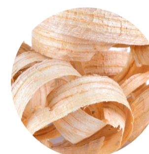
Madera de Cedro