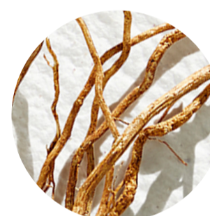
Raíz de Damiana