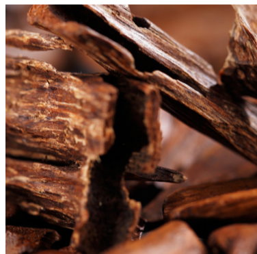
Madera de Cedro