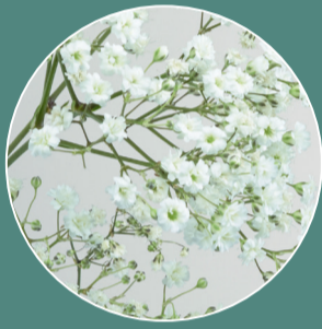
Notas de Corazón FLOR BLANCA