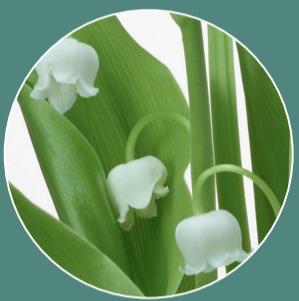
Notas de Salida LIRIO DE LOS VALLES