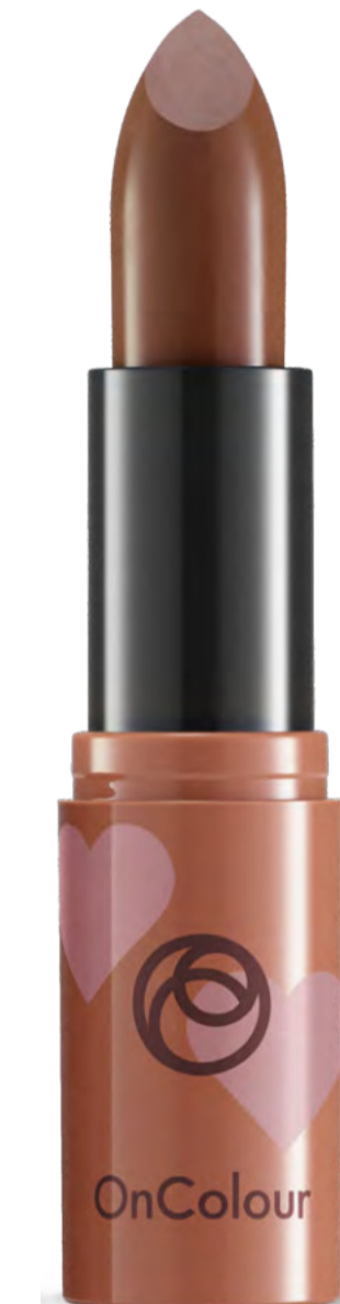
40914 - NSOC94127-19CO Chocolate Rust