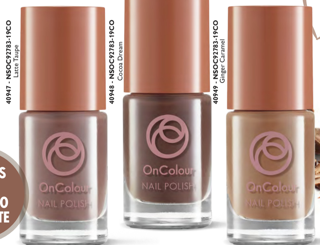
40947 - NSOC92783-19CO Latte Taupe