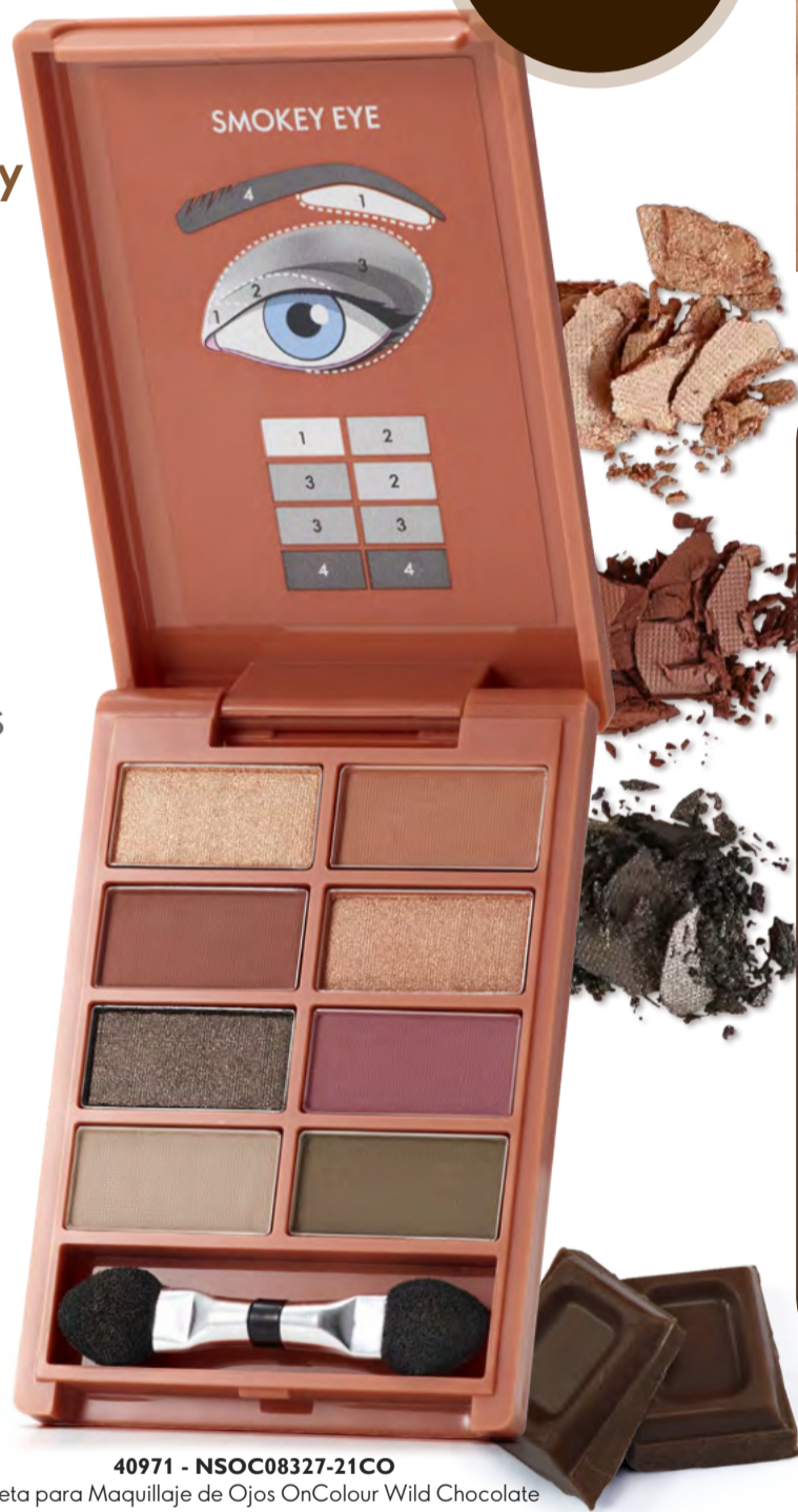
40971 - NSOC08327-21CO Paleta para Maquillaje de Ojos OnColour Wild Chocolate