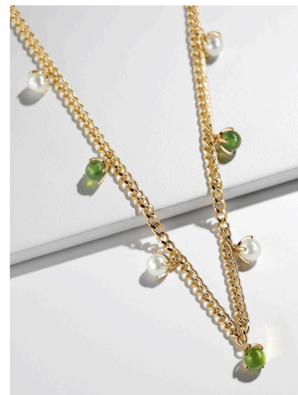
45471 Collar Dew Drop Serpentine

Este par de aretes con su cadena de eslabones en color dorado aporta elegancia. Una sola perla de cristal brillante cae con gracia, mientras que desde el poste una serpentina natural pulida engarzada le da un toque especial a esta maravillosa pieza.