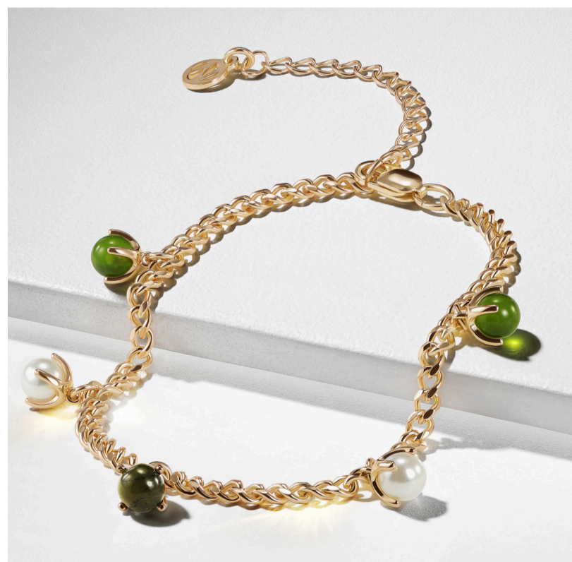
45446 Pulsera Dew Drop Serpentine

Como las gotas de rocío matutino que se adhieren a los tallos de las flores, esta hermosa pulsera dorada tiene engarzadas unas perlas de cristal brillantes y piedras naturales de serpentina pulida. Deslumbra con esta delicada pieza, compañera en cada una de tus nuevas aventuras.