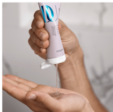
44966 Exfoliante de Cuero Cabelludo

Utilízalo con los productos DUOLOGI para potenciar el cuidado del cuero cabelludo y favorecer un cabello de aspecto sano. Úsalo con: