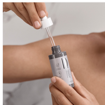
44965 Tónico de Cuero Cabelludo