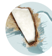
Agua de Coco