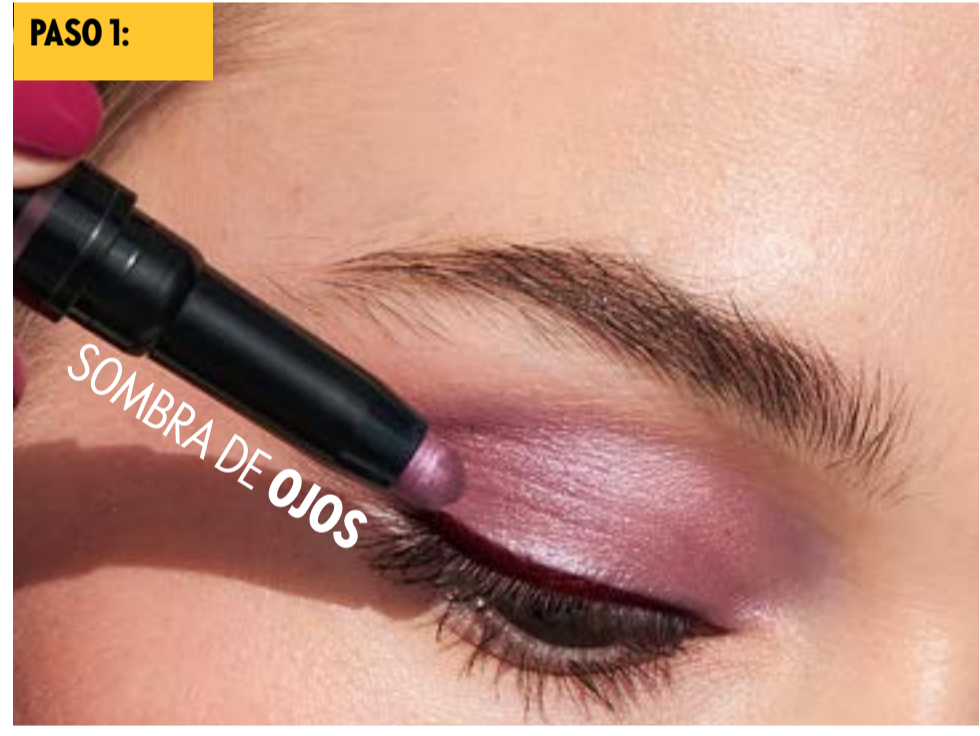
Aplica sobre el párpado y difumina.