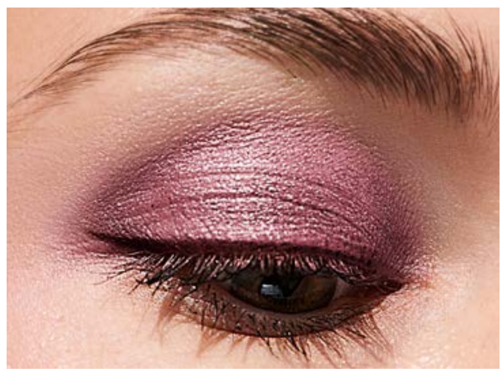
¡LOGRA UN LOOK VIBRANTE!