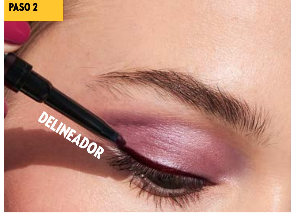
Traza directamente en la línea de las pestañas, desde la esquina interna hasta la externa.