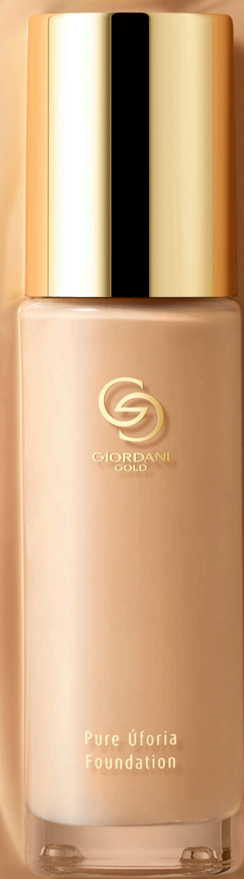
Base de Maquillaje Giordani Gold Pure Úforia 30 ml

¡Un maquillaje de lujo que puedes ver y sentir!