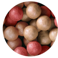
40952 Luminous Tan

Recuerda que también puedes mezclar con nuestros otros tonos de Perlas Giordani Gold