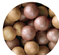
40954 Golden Bronze