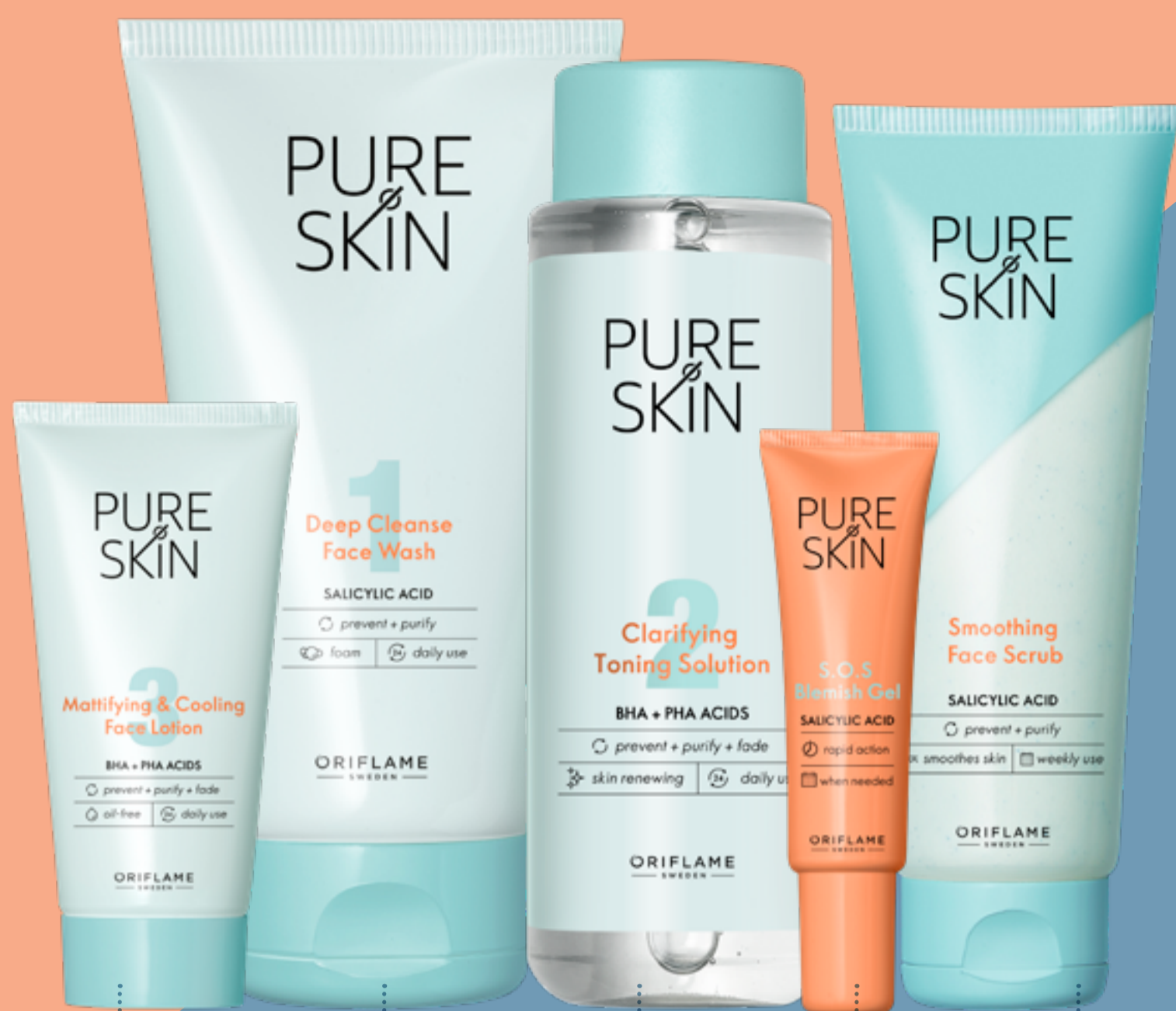
41673 Crema Facial Matificante y Refrescante Pure Skin 50 ml

Pure Skin se ha renovado para ayudarte a tener una piel sana y purificada, pues ahora tiene una fórmula mejorada, creada especialmente para atacar y prevenir imperfecciones en tu rostro al mismo tiempo que ayuda a regular la oleosidad, ¡Para un aspecto libre de brillo e impurezas!