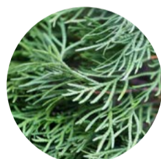
HOJA DE CEDRO