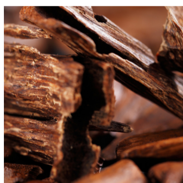
Madera de Cedro