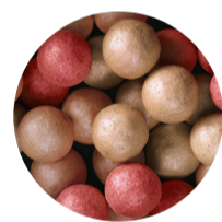
40952 Luminous Tan

Recuerda que también puedes mezclar con nuestros otros tonos de Perlas Giordani Gold