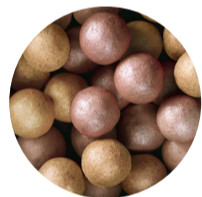
40954 Golden Bronze