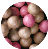
40953 Radiant Rose