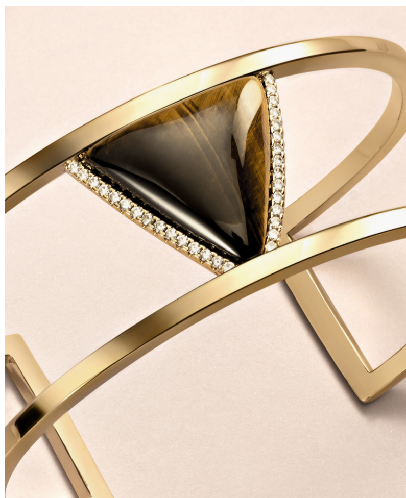
46186 Brazaletes Lavvu Tiger Eye

Aretes dorados con una piedra de Ojo de Tigre en forma de triángulo y cristales de Circonita Cúbica. Medidas: 1.8 x 1.7 cm.