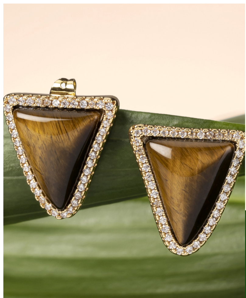
46282 Aretes Lavvu Tiger Eye

Aretes dorados con una piedra de Ojo de Tigre en forma de triángulo y cristales de Circonita Cúbica. Medidas: 1.8 x 1.7 cm.