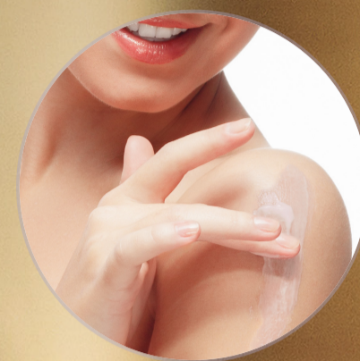
CREMA PARA MANOS Y CUERPO 39450