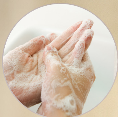
JABÓN PARA MANOS Y CUERPO 39448

Dale un toque sofisticado a tu baño y una sensación refrescante a tu piel con la nueva y elegante gama para manos y cuerpo de Essense & Co , enriquecida con extracto de azafrán y aceite esencial de pachulí.