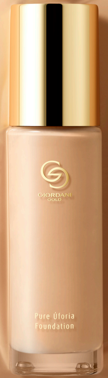
Base de Maquillaje Giordani Gold Pure Úforia 30 ml

¡Un maquillaje de lujo que puedes ver y sentir!