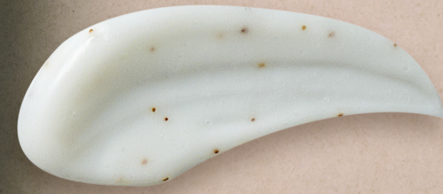
42614 Exfoliante Facial Multibeneficios Optimals