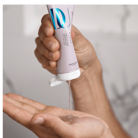
44966 Exfoliante de Cuero Cabelludo

Utilízalo con los productos DUOLOGI para potenciar el cuidado del cuero cabelludo y favorecer un cabello de aspecto sano. Úsalo con: