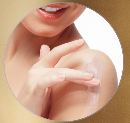
CREMA PARA MANOS Y CUERPO 39450 NSOC13969-22CO