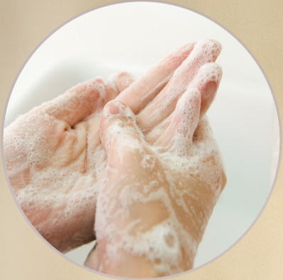
JABÓN PARA MANOS Y CUERPO 39448 NSOC13971-22CO

Dale un toque sofisticado a tu baño y una sensación refrescante a tu piel con la nueva y elegante gama para manos y cuerpo de Essense & Co , enriquecida con extracto de azafrán y aceite esencial de pachulí.